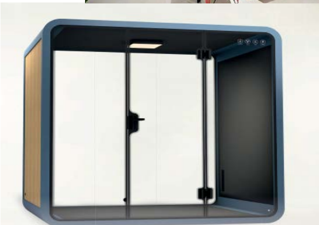
PANELÉS MOVABLE SILENCE BOOTH